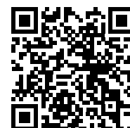
QR Code Adresse Text